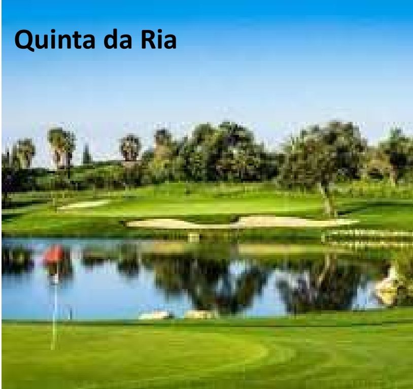
Quinta da Ria